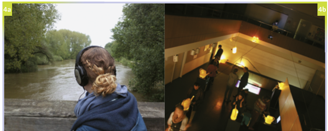
Bildpaar 4 Die neuen Medien ermöglichen neue Vermittlungs- und Wahrnehmungsweisen draußen und während der langen Nacht der Forschung 2012. Abbildungen: Tonspur Stadtlandschaft/Friederike Maus

Thema Wald unterhaltsam vermittelt, und Kinder, die noch nicht lesen können, erkunden die Station eigenständig. Die Konzeption, das Schreiben der Texte und Dialoge und die Produktion des Audioguides nahmen ein gesamtes Semester in Anspruch. Die Studierenden beschäftigten sich intensiv mit den grundsätzlichen Einsatzmöglichkeiten von Audioguides. Inzwischen ist das Produkt ausleih- und downloadbar und wird von vielen Besuchern verwendet ( https://www.hannover.de/Kultur-Freizeit/Naherholung/Natur-verstehen/Naturlernorte/Waldstation-Eilenriede/Audioguide ). Während der Langen Nacht der Forschung 2012 wurden die auditiven Arbeiten der Studierenden öffentlich präsentiert. Professionelle Radiojournalisten und Klangspezialistinnen nutzen den zunehmend attraktiven auditiven Wahrnehmungskanal schon länger. Hier setzt das EFRE-Ausgründungsprojekt: »Tonspur Stadtlandschaft« von Stefanie